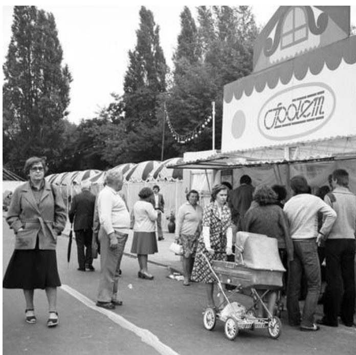
Pod stoiskiem WSS „Spółem”, data wydarzenia: 1979-07-20, miejsce: Warszawa 5.