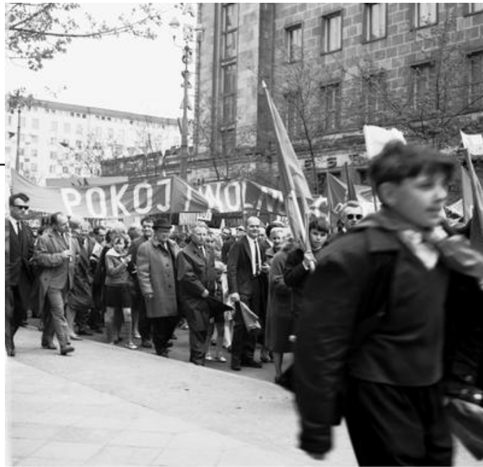
Pochód pierwszomajowy na ulicy Świętokrzyskiej. W tle widoczny hotel Warszawa, data wydarzenia: 1967-05-01, miejsce: Warszawa 3.