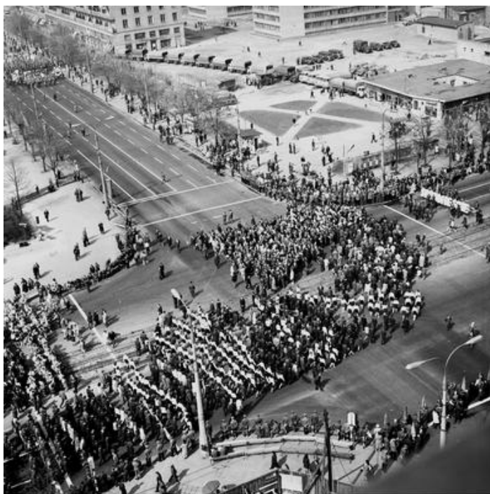
Pochód na skrzyżowaniu ulic Marszałkowskiej i Świętokrzyskiej – widok z góry, data wydarzenia: 1969-05-01, miejsce: Warszawa 4.